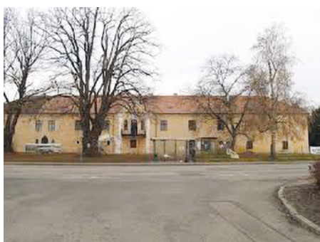
Celkový pohled na zámek z ulice