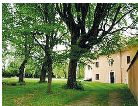
Panorama hlavního vchodu do zámku