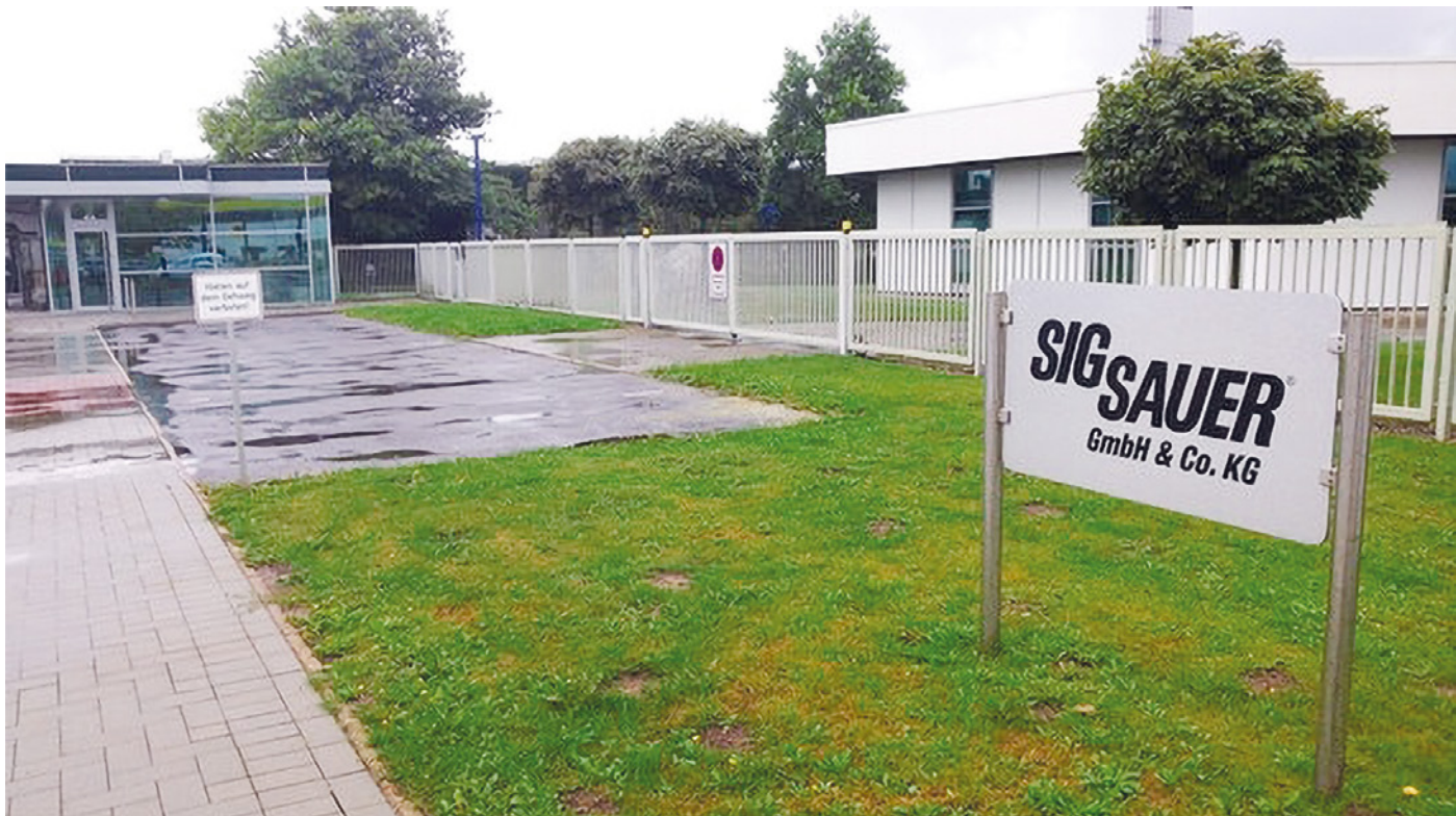
Světově známá zbrojovka „Sig Sauer GmbH & Co. KG“ v Eckenförde (SRN) končí. 125 zaměstnanců na „dlažbě“...