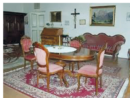
Zařízení hlavního interiéru

CZECH ATLANTIC FORUM (CZAF), vychází čtvrtletně v nákladu 1000 výtisků.