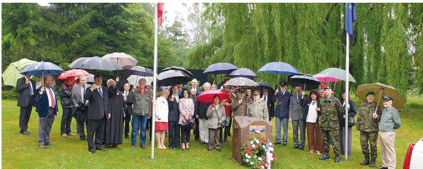
Anzac Day 2020 v zámeckém parku barokního zámku Tábor-Měšice, 20. 06. 2020. Počasí nám opravdu nepřálo...