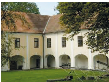
Západní křídlo zámku a portál