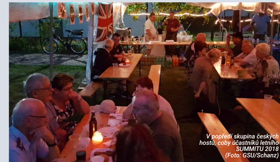
V popředí skupina českých hostů, coby účastníků letního SUMMITU 2018

Weiterlesen: GSU-Verein unterstützt BERLINER FORUM