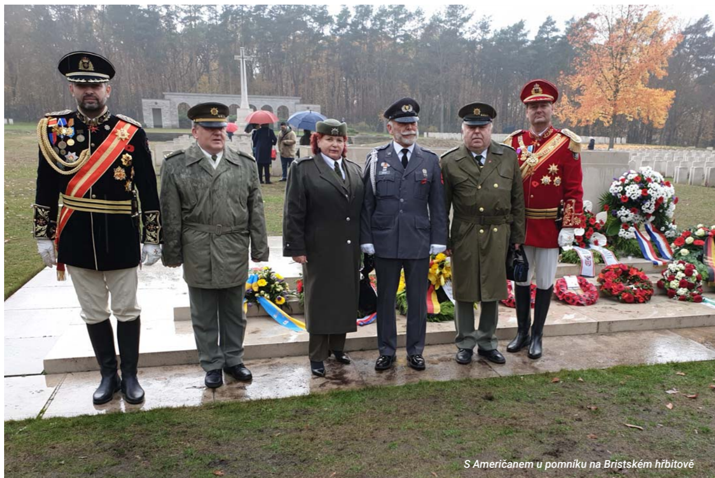
S Američanem u pomníku na Bristockém hřbitově