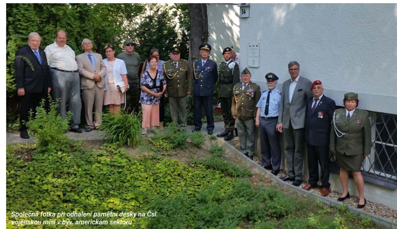
Společná fotka při odhalení pamětní desky na Čsl. vojenskou misi v býv. americkém sektoru