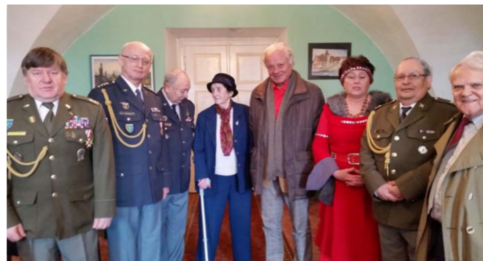
Přednáška k 50. výročí „Pražského jara 1968“, přednesená na barokním zámku v Táboře - Měšicích.

Mnozí byli i nositeli modrých knížek, za některých došlo také k absurdním situacím a rozhodnutím, že se o tom psalo po celém světě.