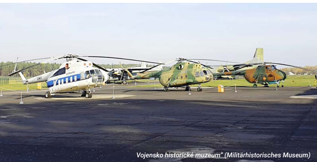
Vojensko historické muzeum“ (Militärhistorisches Museum)