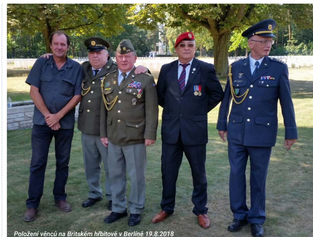
Položení věnců na Britském hřbitově v Berlíně 19. 8. 2018