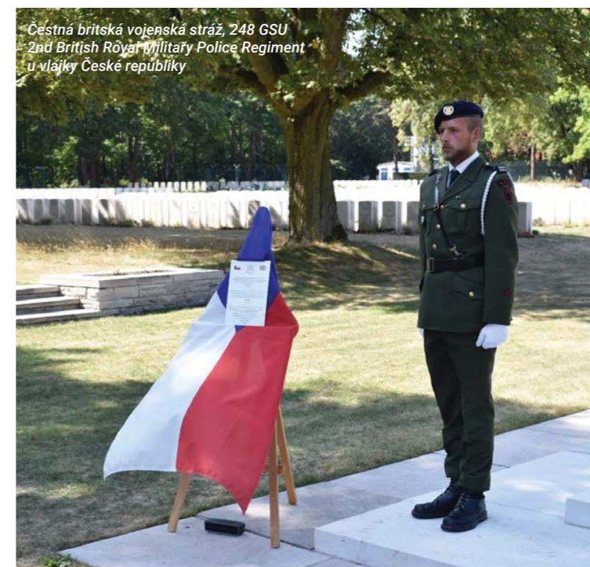
Čestná britská vojenská stráž, 248 GSU 2nd British Royal Military Police Regiment u vlajky České republiky