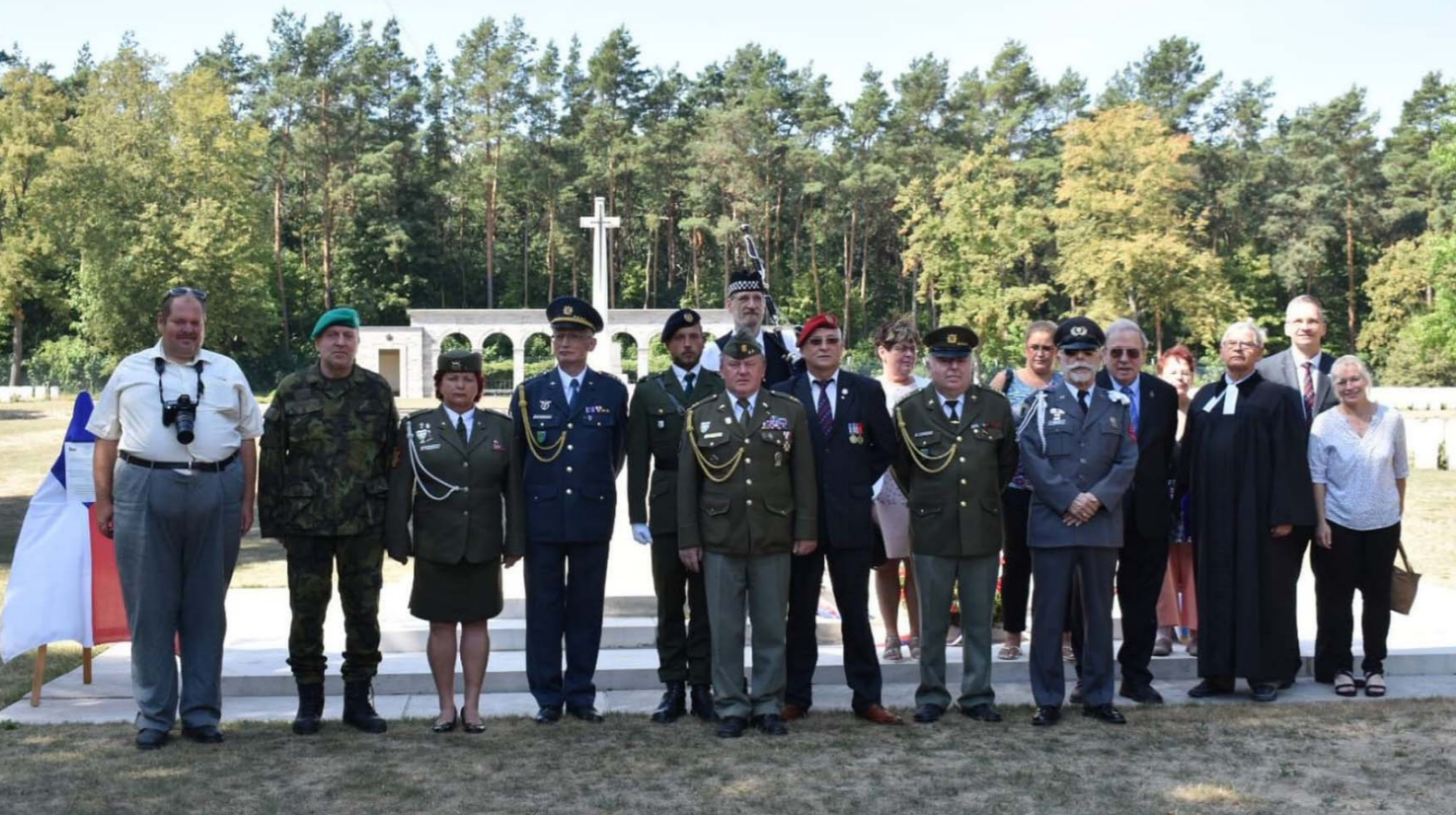
V popředí skupina českých hostů, coby účastníků letního SUMMITU 2018