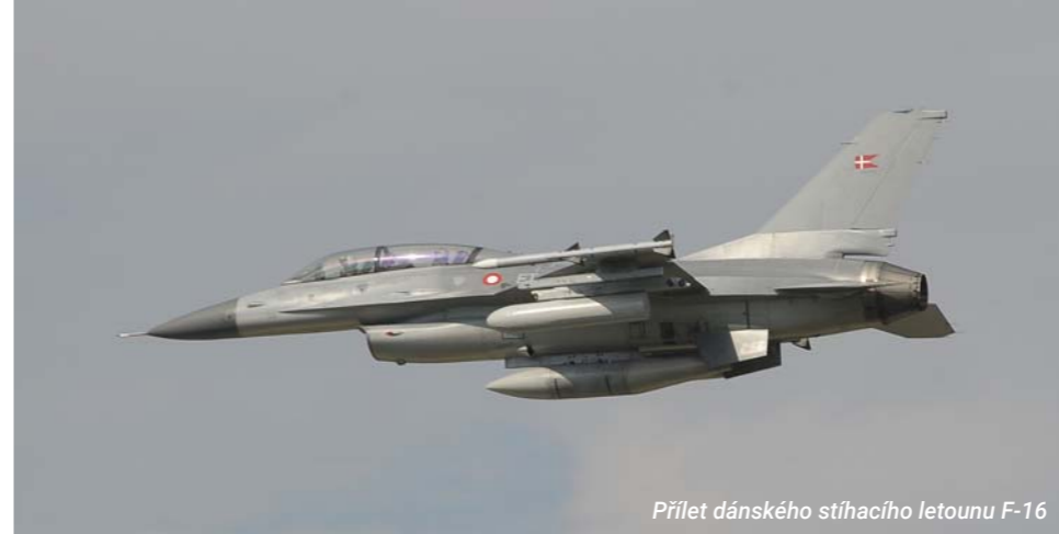
Přilet dánského stíhacího letounu F-16

Poslední použití letiště nacisty se konalo dne 26. 04. 1945, kdy zde přistála legendární německá pilotka Hanna Reitschová s generálplukovníkem Robertem von Greimem, aby odvezli Hitlera z jeho bunkru pod Říšským kancléřstvím do bezpečí bavorských Alp.