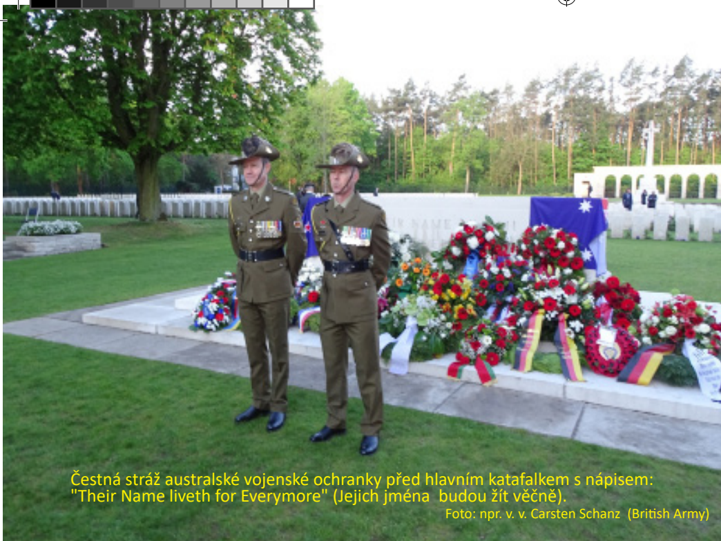
Čestná stráž australské vojenské ochranky před hlavním katafalkem s nápisem: "Their Name liveth for Evermore" (Jejich jména budou žít věčně).

Západní Berlín), kde bylo v místní „sekyrárně“ v letech 1939 – 1945 popraveno 111 (konkrétně doloženo je 109) československých prvo republikových důstojníků.