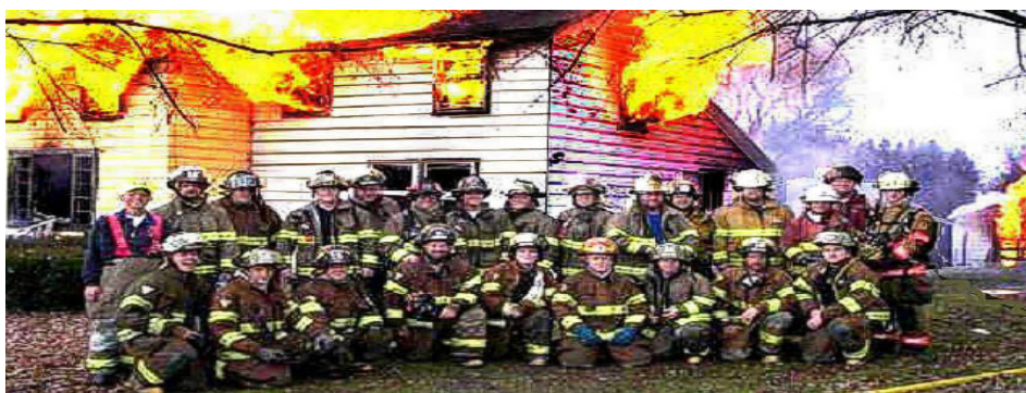
FOTO NA PAMÁTKU ! Americký, vojenský požární sbor (Pennsylvánie, USA) (Z amerického vojenského humoru)