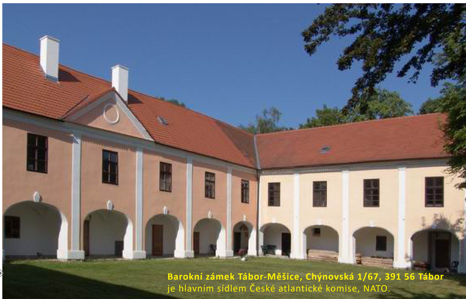
Barokní zámek Tábor-Měšice, Chýnovská 1/67, 391 56 Tábor je hlavním sídlem České atlantické komise, NATO.

Na zámku se nalézají stálé výstavy " Přepadení Československa armádami Varšavské smlouvy 21.08. 1968 " jakož i " Americké historické akce z doby studené války ". Dále " Výstava akcí a cenných papírů Spolkové republiky Německo z doby tzv. 'Německého hospodářského zázraku' 1948 - 1967 ". Zámek je přístupný veřejnosti po předchozím ohlášení pro skupiny nejméně 5 osob.