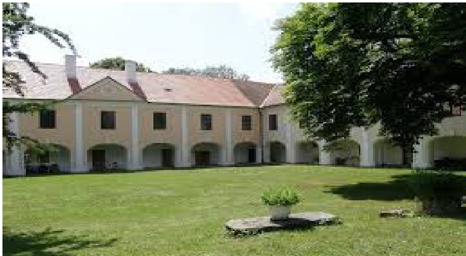
Vyklizené nádvoří barokního zámku Tábor-Měšice s tropickým vedrem 55 stupňů Celsia (na slunci).

Návštěvnost byla minimální a nechat rytíře předvádět bojové ukázky na parném nádvoří barokního zámku by se rovnalo sebevraždě. Teplota na slunci přesahovala dokonce vražednou hranici 55 stupňů. Bylo skoro nemožné se v klasických středověkých kostýmech pohybovat. Pot stékal proudem a nesmírně těžce se dýchalo. Předvedli jsme pouze několik symbolických ukávek ve stínu. Na víc nám nestačily síly.