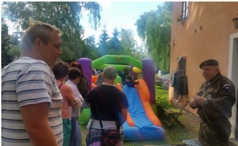
Největší zájem měly děti o „skluzavku NATO“.

„Čert nikdy nespí!“ jak kdysi prohlásil klasik a vpravdě řečeno byl Dábel v Táboře-Měšicích dne 30. 06. 2019 až zatraceně bdělý. Zámecký park zavalilo vedro, kde se ručička teploměru vyhoupla až na 38 stupňů Celsia ve stínu staletých vrb.