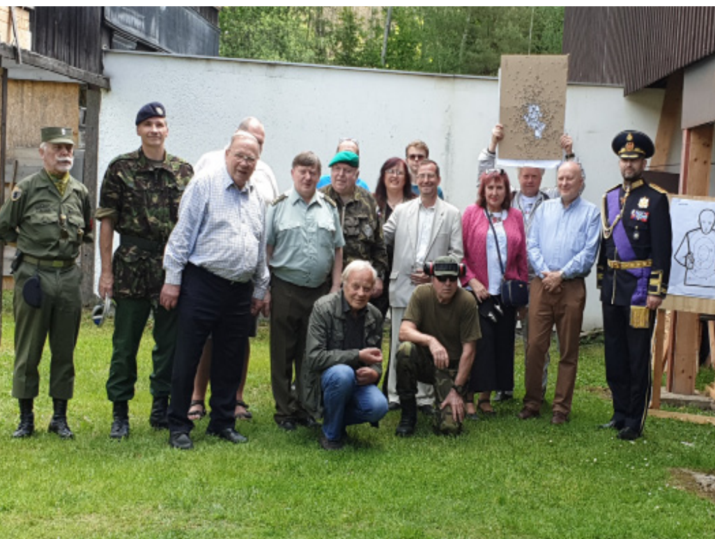
Tuzemští i zahraniční účastníci "Mezinárodního střeleckého tréninku, Borek 2019".