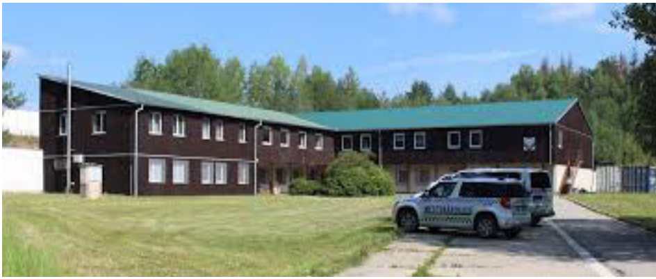
Střelnice v Borku u Českých Budějovic

obranu České republiky jako celku. Kvalita, pravidelnost a komplexní zaměření přípravy občanů k obraně státu přispívají ke snižování škod na majetku a zejména ke snižování ztrát na lidských životech při vyhlášení stavu ohrožení státu nebo válečného stavu, ale i při běžných mimořádných událostech či za krizových situacích nevojenského charakteru...“