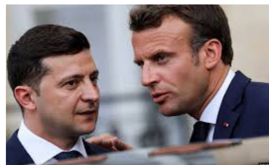
Ukrajinský prezident Volodymyr Zelenskyy s francouzským prezidentem Emmanuelem Macronem

(Převzato z „ATA HQ Hot topic of week“, červen 2019).