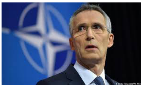
Jens Stoltenberg generální tajemník NATO