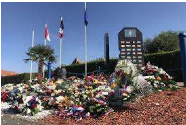
70. výročí NATO. Pomník ( NATO Memorial Federation ), Fréthun, severní Francie 2019