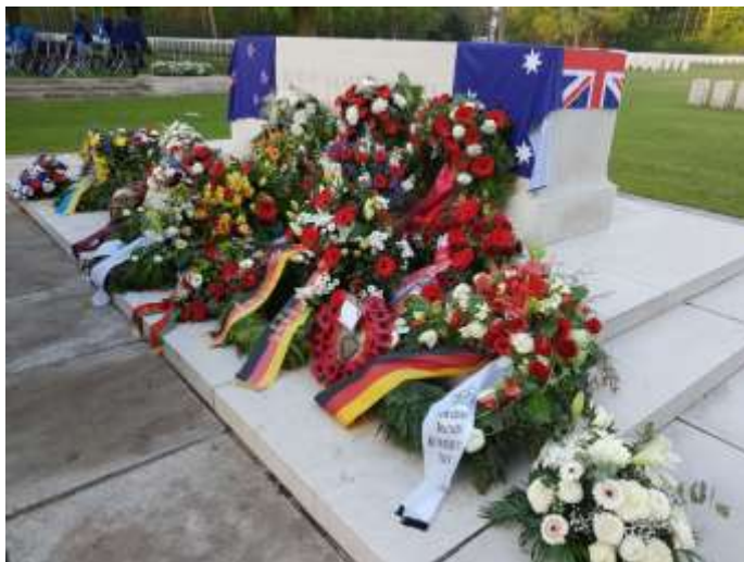
Anzac Day, British War Cemetery, 25. duben, Berlín 2019