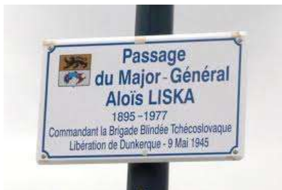
Ulice generálmajora Aloise Lišky, osvoboditele francouzského přístavu Dunkerque ( Commandant la Brigade Blindée Tchécoslovaque Libération de Dunkerque – 9 Mai 1945 )