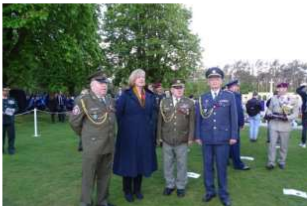
Delegace ČAKO s australskou velvyslankyní v SRN Lady Lynette Woodovou, British War Cemetery , „Anzac Day“, Berlín 2018