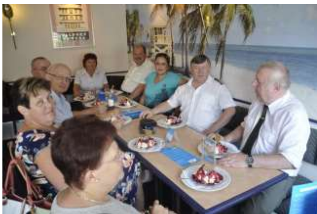
Delegace ČAKO ve světoznámé “FLORIDA EISCAFÉ” (Zmrzlinová kavárna Florida) při místní specialitě „Spaghetti Eis“ (špagetová zmrzlina), Berlín 2018