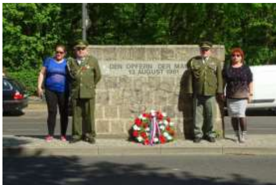
Delegace ČAKO položila věnec k pomníku obětem Berlínské zdi. Nápis: „Obětem Berlínské zdi, 13. srpen 1961“, bývalý Západní Berlín 2019