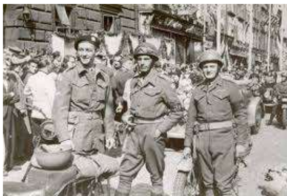
Jednotky Československé obrněné brigády , osvobozují důležitý francouzský přístav Dunkerque (9. 5. 1945), severní Francie 1945