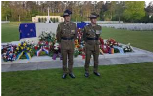
ANZAC DAY, Berlín 2018