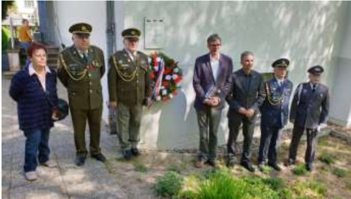
Bývalá Československá vojenská mise v Západním Berlíně (1946 – 1990). Pietní akt na památku obětí komunistické perzekuce generálů Františka Hrabčíka (1894 – 1967) a Václava Palečka (1901 – 1970) za účasti amerických a britských vojenských veteránů, Berlín 2018