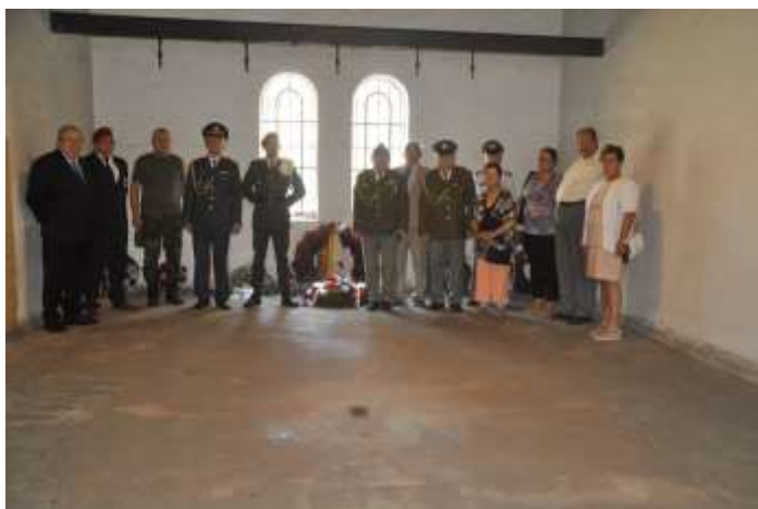
Delegace ČAKO, spolu s veterány Britské královské vojenské policie (GSU), položila věnce k památníku popravených československých důstojníků v letech 1938 - 1945, Berlín-Plötzensee 2018