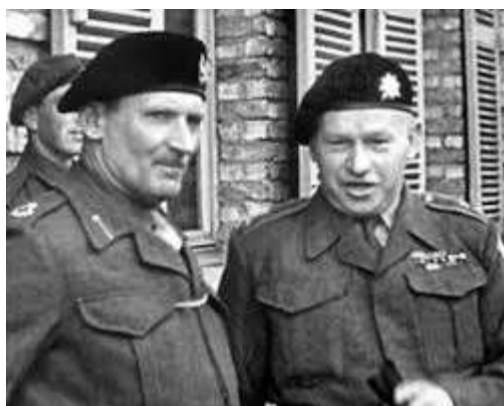
Vrchní velitel Československé obrněné brigády , generál Alois Liška (vpravo) s britským generálem Sirem Bernardem Montgomerym (Normandie 1944)