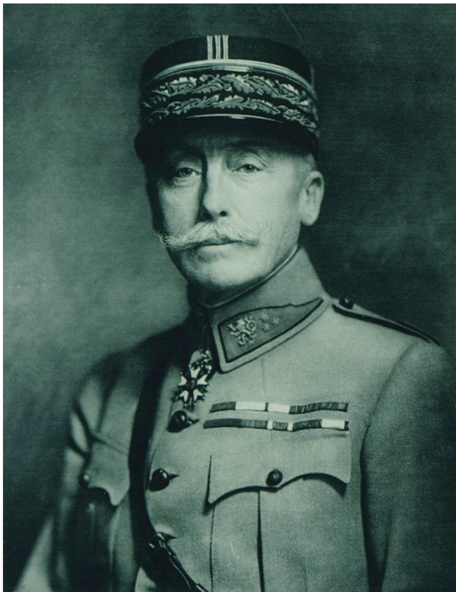
Generalisimus Maurice Pellé

K „ nadstavbě francouzské ideologické kontroly “ patřili rovněž naši svatí – sv. Václav a sv. Jan Nepomucký. Podle představ pa-