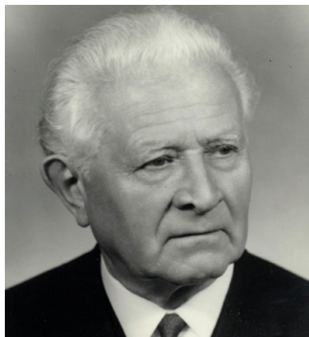
generál Ludvík Svoboda