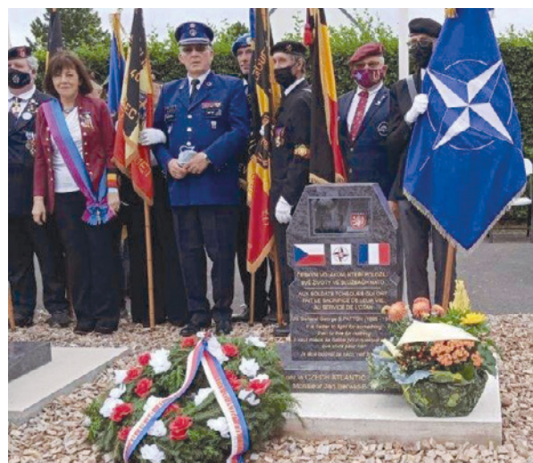
Poté, co se belgická královská delegace dozvěděla, že československá obrněná brigáda pod vedením generála Aloise Lišky osvobodila 1944 jižní Belgie, postavili se účastníci královské delegace demonstrativně za český pomník...