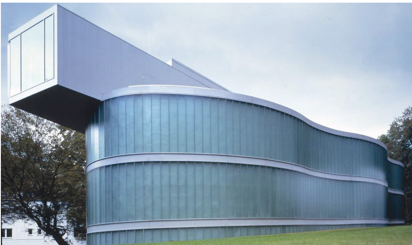
„Neandrtálské muzeum“ v Mettmannu, SRN