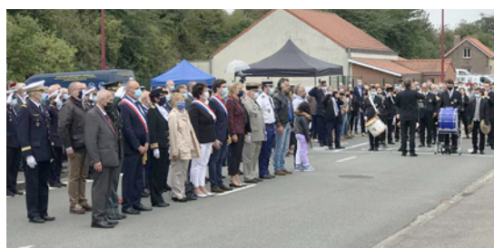
Odhalení památníku českým vojákům padlým v misích NATO se ve francouzském Fréthunu zúčastnilo cca 1200 návštěvníků z celého světa

de haut rang, distingués invités et collègues!