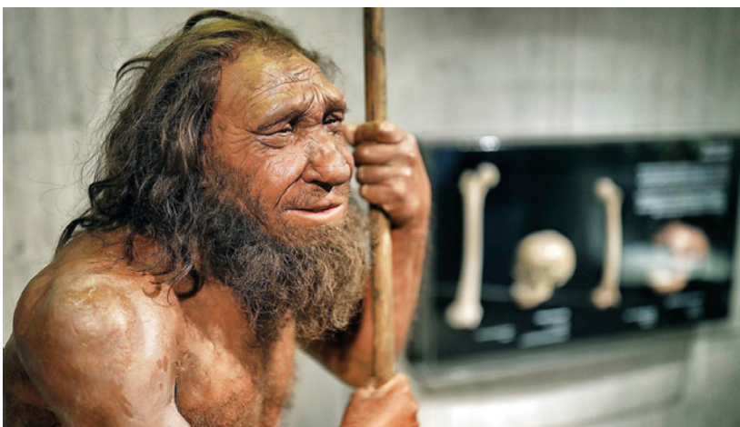
Tak, jako vypadáme dnes, jsme začali vypadat před 20.000 lety