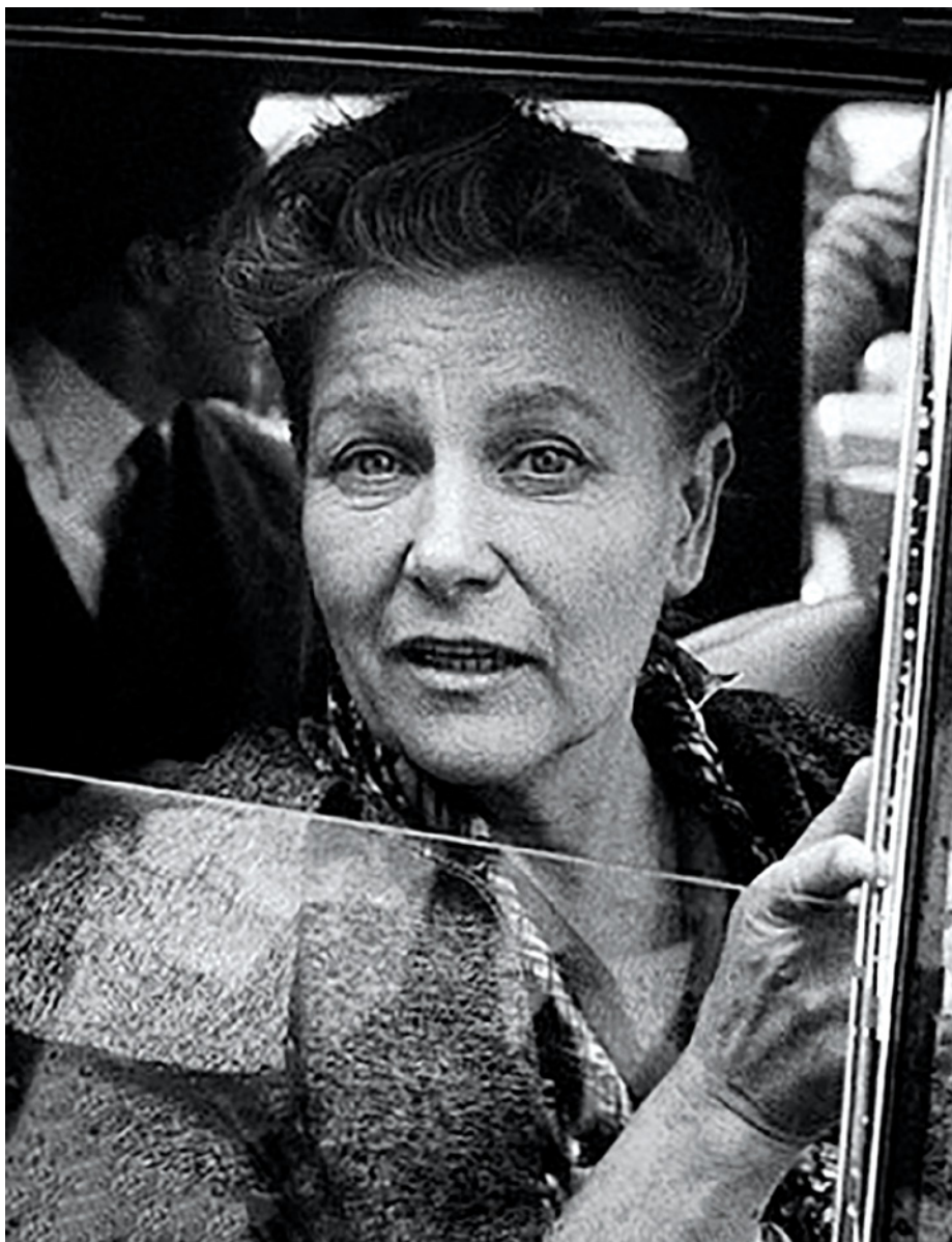
Jekaterina Furceva (1910–1974)

travin Židům, rozdávala jsem chleba našim židovským spoluobčanům. Kdybyste zítra hladověl Vy, soudruhu komisaři, dala bych chleba Vám.“