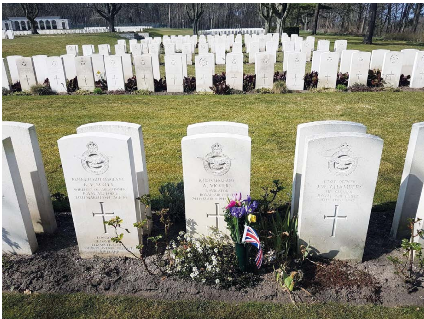
Britský válečný hřbitov Berlín-Charlottenburg (Westend)

durch den Bürgermeister aufgefunden. Niemand der Besatzungsmitglieder hatte die Explosion und den Absturz überlebt.