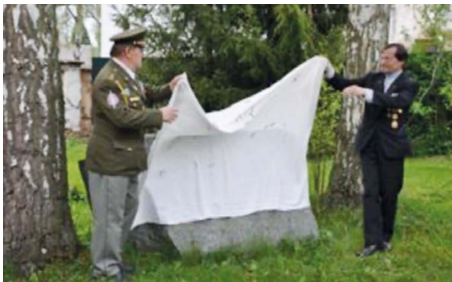
Odhalování základního kamene