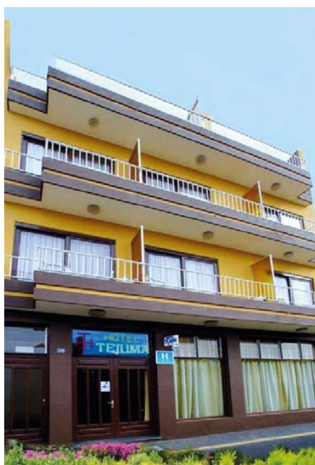
Hotel „Residencia Tejuma“