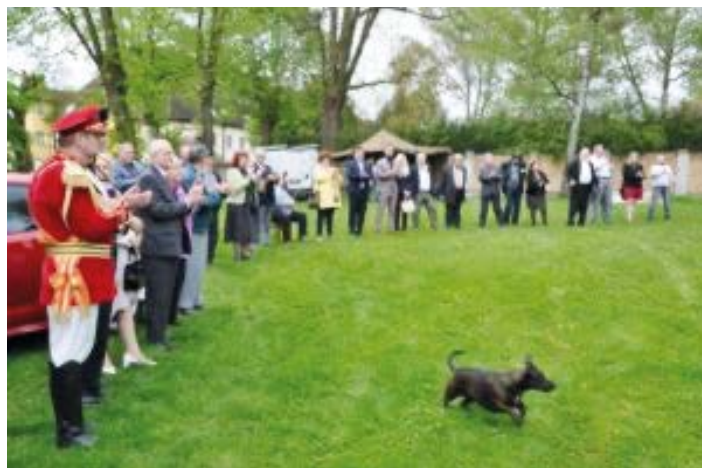
Již 3.ročníku ANZAC DAY se zúčastnily desítky účastníků z tuzemska i ze zahraničí