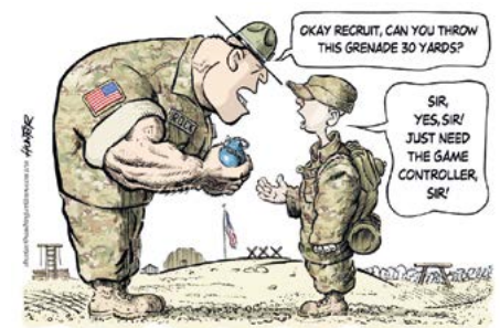
Our technologically disadvantaged armed forces

„Milý vojáku, jseš schopen hodit ten granát 30 yardů?“ „Ano pane, jistě pane, ale nebylo by jednoduší kdybych to udělal počítačem, pane!“ (Z amerického vojenského humoru)