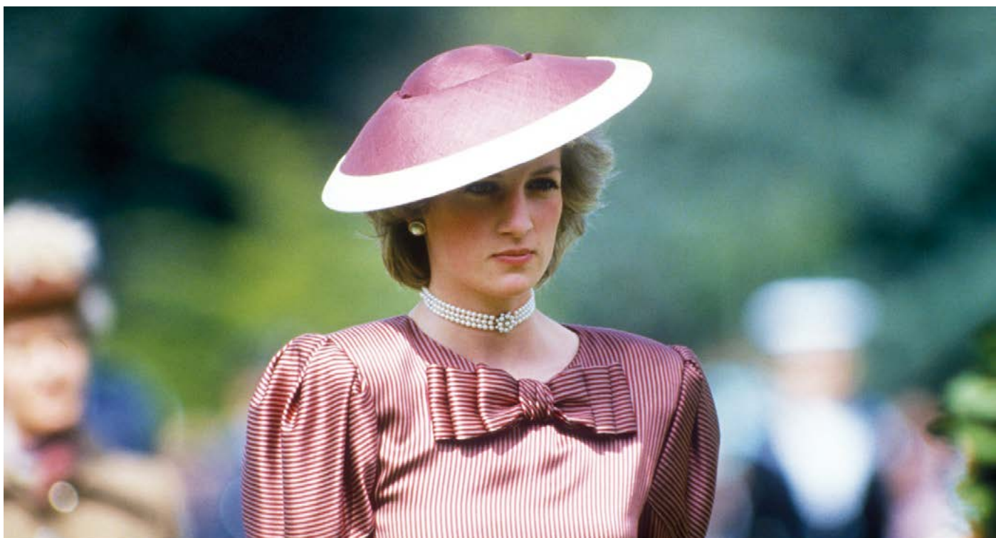
Diana se oblékala z protestu nevhodně. Když její garderóbu královna viděla šly na ní mráčky

na koni. S princem Charlesem se rozvedla a jejím posledním milencem byl Egyptan Dodi Al-Fayed, majitel největšího obchodního domu v Londýně „Herrods“. Údajně s ním byla v jiném stavu. Oba zemřeli při dopravní nehodě 30. 08. 1997 v Paříži.