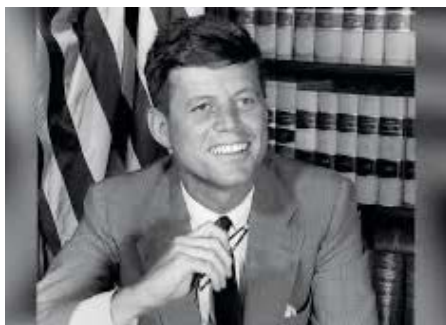
John F. Kennedy, 35. prezident USA