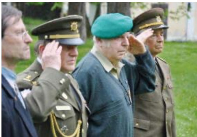
Vzdání úcty obětem státního násilí - ANZAC DAY