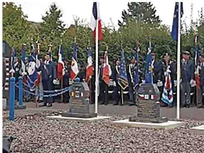
NATO Mémoriál 2022