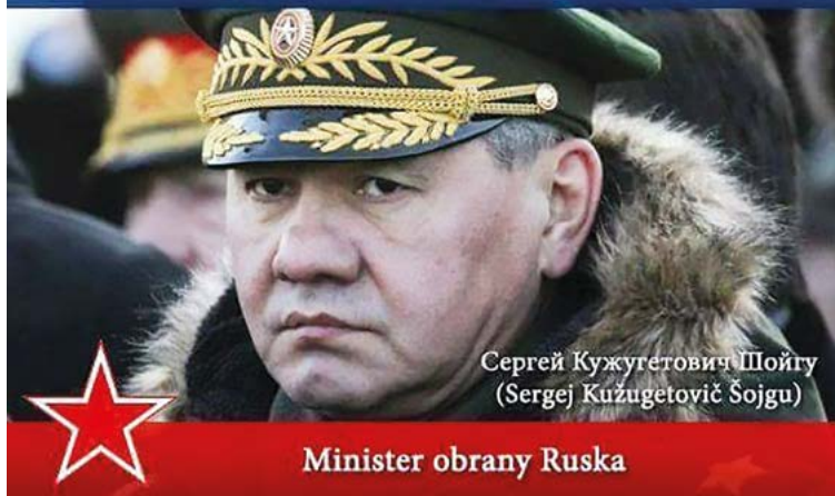
Сергей Кужугетович Шойгу (Sergej Kuzugetovič Šojgu)

Dokáží tyto dámy porazit onoho válečného zločince?