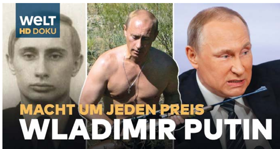
VLADIMIR VLADIMIROVIČ PUTIN – Moc za každou cenu!