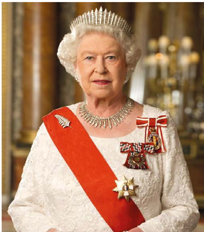
Britská královna Alžběta II.

Dne 8. 9. 2022 zemřela britská královna Alžběta II. ve věku 96 let (21. 4. 1926–8. 9. 2022).