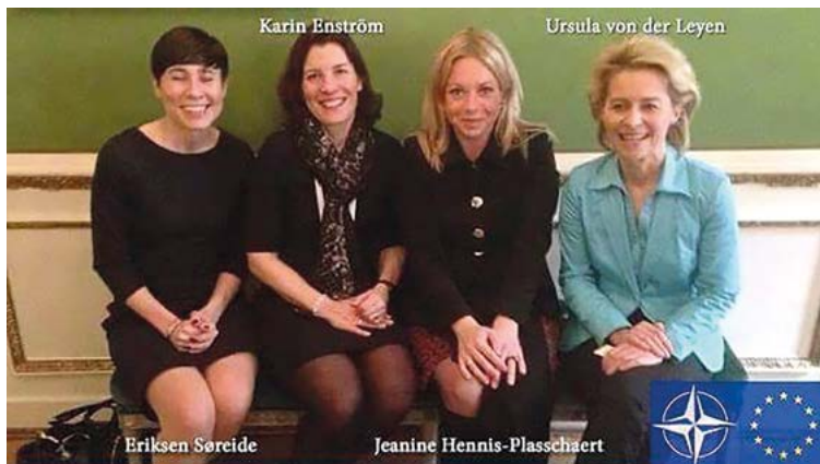
Ministri obrany Švédska, Nórska, Holandska a Nemecka