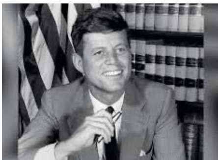
John F. Kennedy, 35. prezident USA