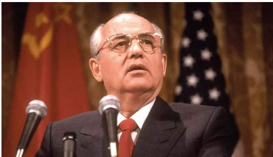
Michail Gorbačov (1931-2022) v USA 1990

k nástupu Putinovy oligarchické, neofašistické diktatury a v ko- nečné fázi k agresivní válce proti Ukrajině...