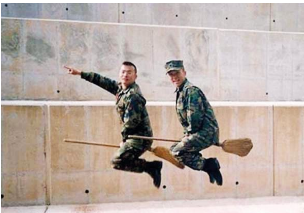
Od té doby, co v naší armádě slouží ženy, jsme se na tom naučili létat... (Z francouzského vojenského humoru)