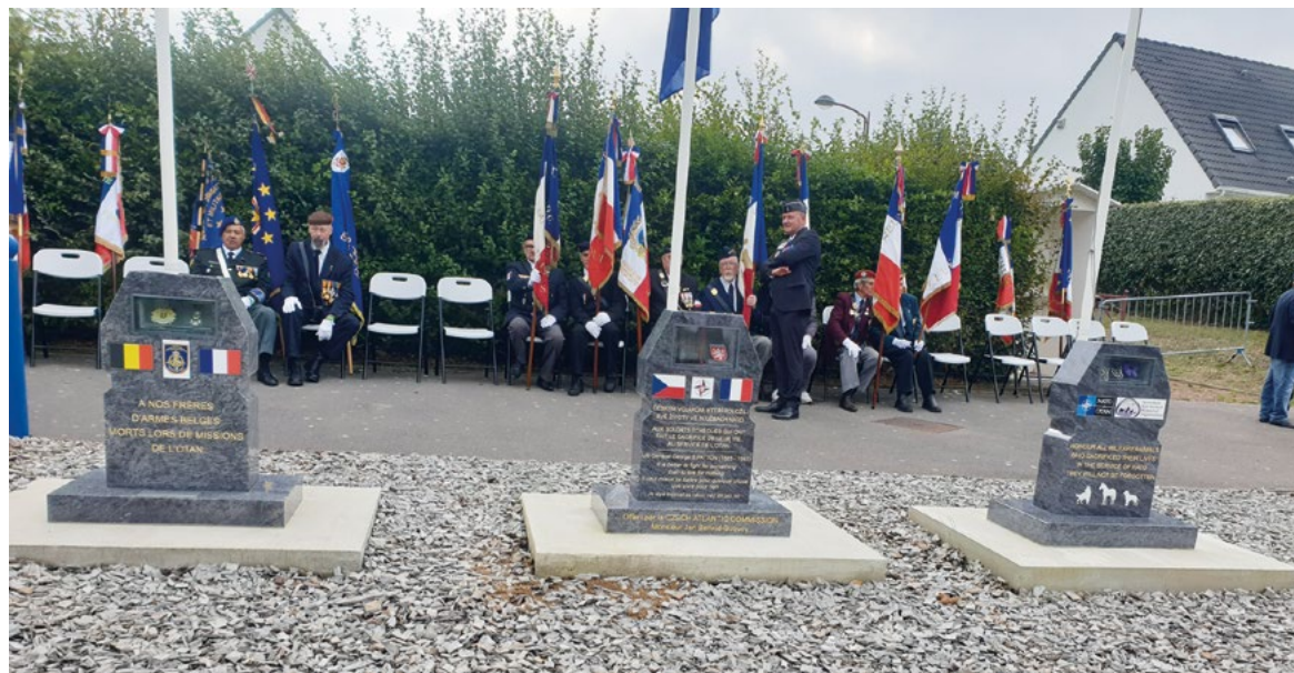
Pomníky padlým vojákům v zahraničních misích NATO: vlevo SRN, uprostřed ČR, australský pomník upravo je věnován zahynulým zvířatům v zahraničních misích NATO.