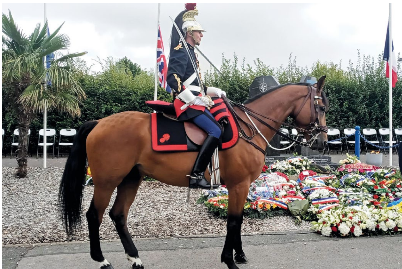
Francouzský prezident, Emmanuel Macron, vyslal do Fréthunu vládní gardu dragounů.