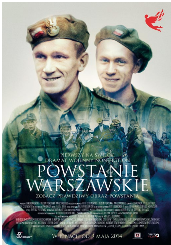
Poláci rozdávali letáky s upozorněním na "Varšavské povstání" v roce 1944.