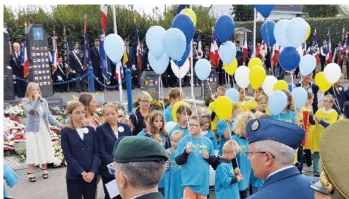
Balónky v barvách solidarity s Ukrajinou...