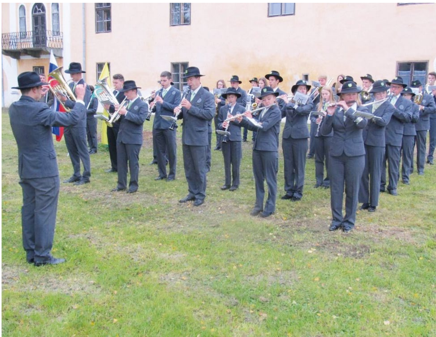
Čtyřiceti členná slovinská kapela před zámkem v Měšicích.