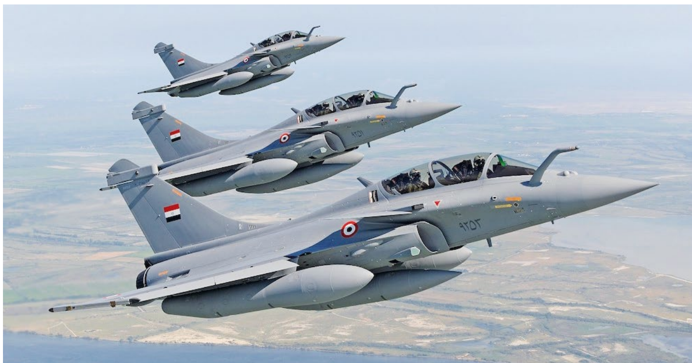
Na zahájení oslav přeletěla nad Fréthunem letka stíhaček „Rafael“ z perutě 11 F „Patrouille de France“.