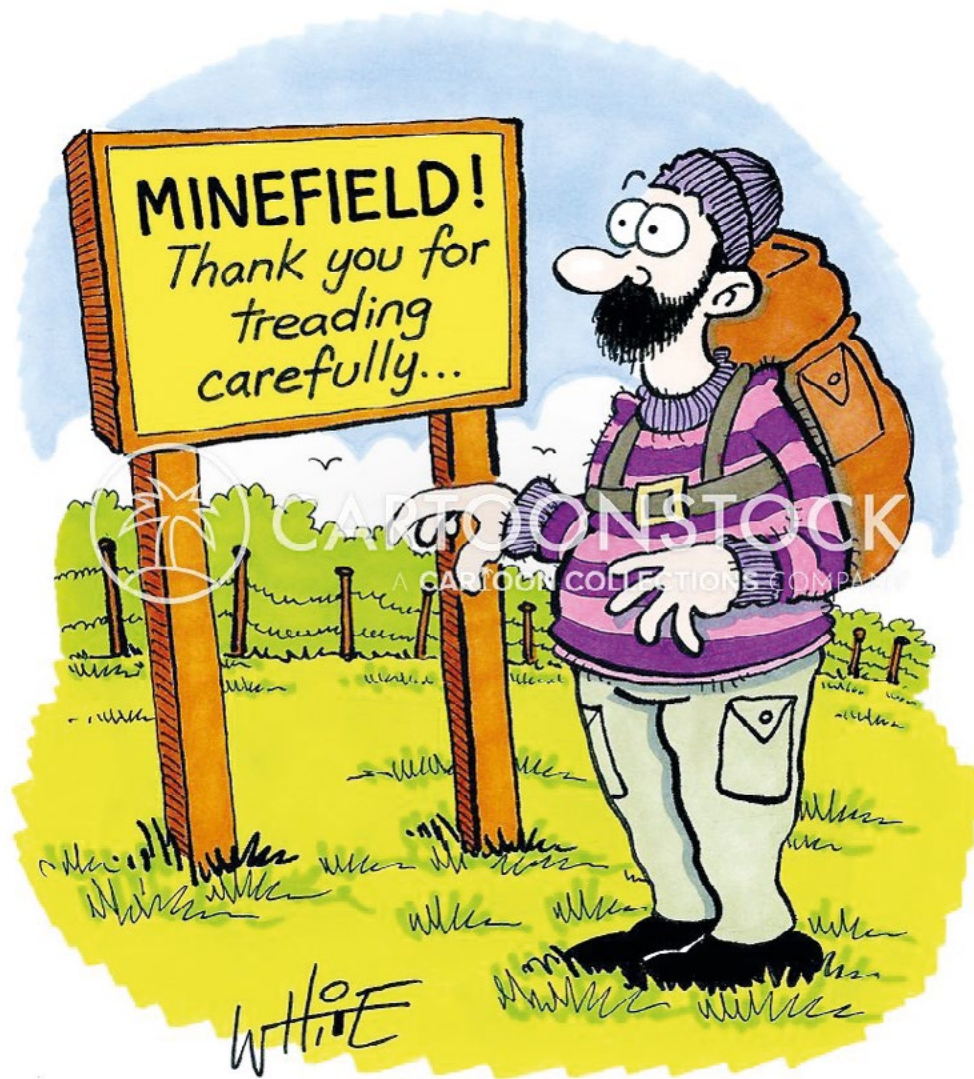
MINOVÉ POLE! - Děkujeme Vám, že našlapujete opatrně! (Z amerického vojenského humoru)