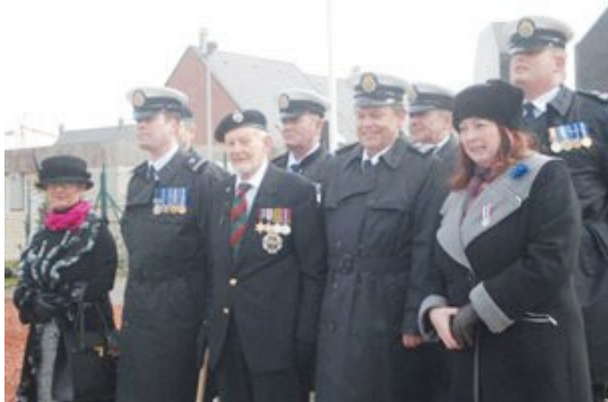
Královská britská legie (Royal British Legion) podřízená přímo Karlovi III.