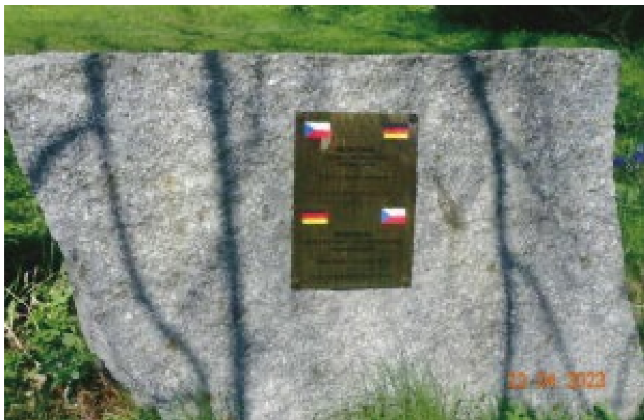
MEMORIÁL ČESKO-NĚMECKÉHO PŘÁTELSTVÍ, zámecký park barokního zámku Tábor-Měšice Vystavěla a dotovala Mag. Bärbel Berwidová-Buquoyová, 1.Tajemnice Obvodního soudu Berlín-Wedding v.u.

Europäer in einer Zeit, in der vielfach die Wiederkehr des Na- tionalismus droht“