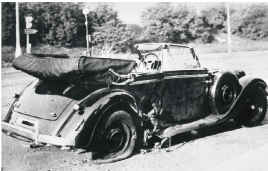
Heydrichovo služební auto po atentátu...

máždili mladí důstojníci a jeden z nich promluvil: „Vaše vévodská Výsosti, vy umíráte s obrovskými zkušenostmi, které jste během svého života získal. Řekněte nám Vaši největší pravdu Vašeho života. My ji budeme potřebovat.“