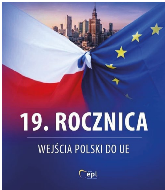
„19. výročí vstupu Polska do Evropské unie“

tribute to developing European strategic autonomy in foreign and security policy and in the defence industry, under French leadership. Paris argues that Europe should strive for sovereignty in international politics in the face of an increasing strategic competition between great powers (the US and China) and of mounting differences in how Europe and the US view values and interests. Since 2016, France has been the driving force in the EU promoting the development of defence initiatives such as PESCO and the European Defence Fund. Paris (alongside Berlin)