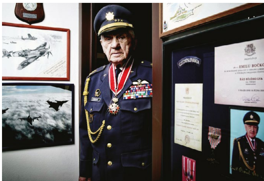
Služba v RAF (2. světová válka)