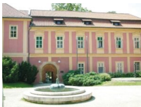
Muzeum Policie ČR, Praha-Karlov

V úterý 6. 6. 2023 se v Muzeu Policie ČR na pražském Karlově uskutečnilo již páté Křeslo pro hosta – setkání s osobností české bezpečnostní komunity.