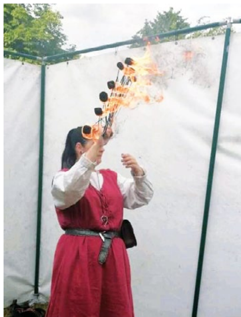
◀◀ Polykač ohně...