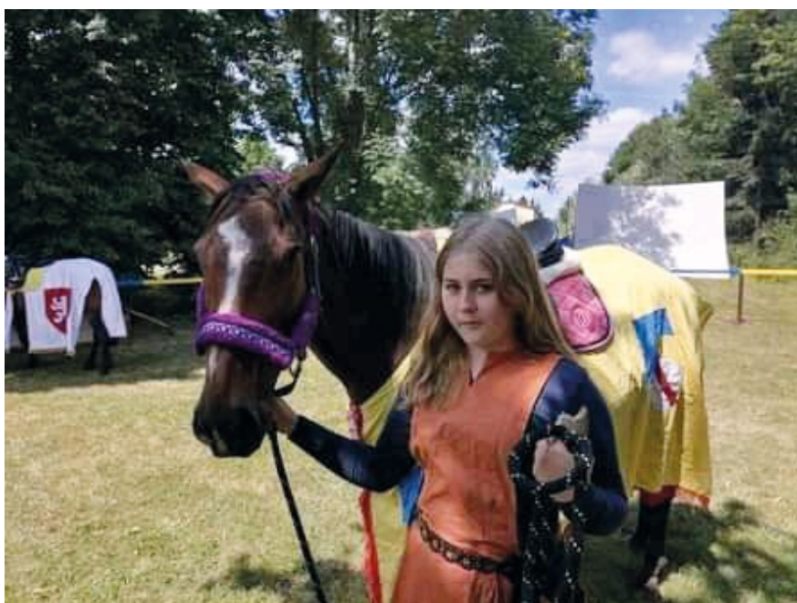
Osedlané koně se znaky „Království českého“