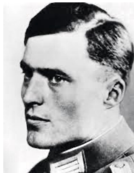
Plukovník Claus Schenk hrabě Stauffenberg