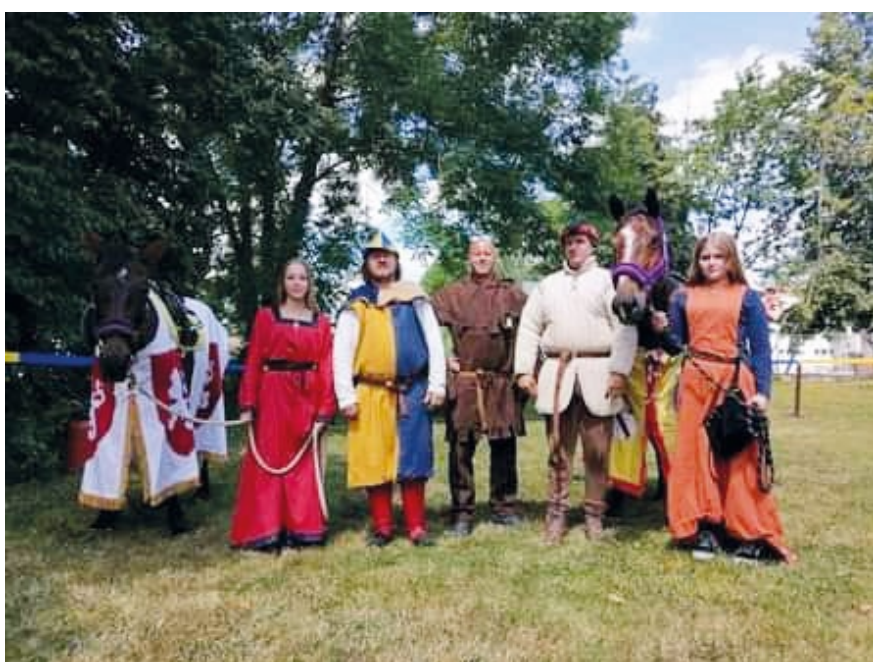
„Středověcí válečníci“ jsou připraveni!