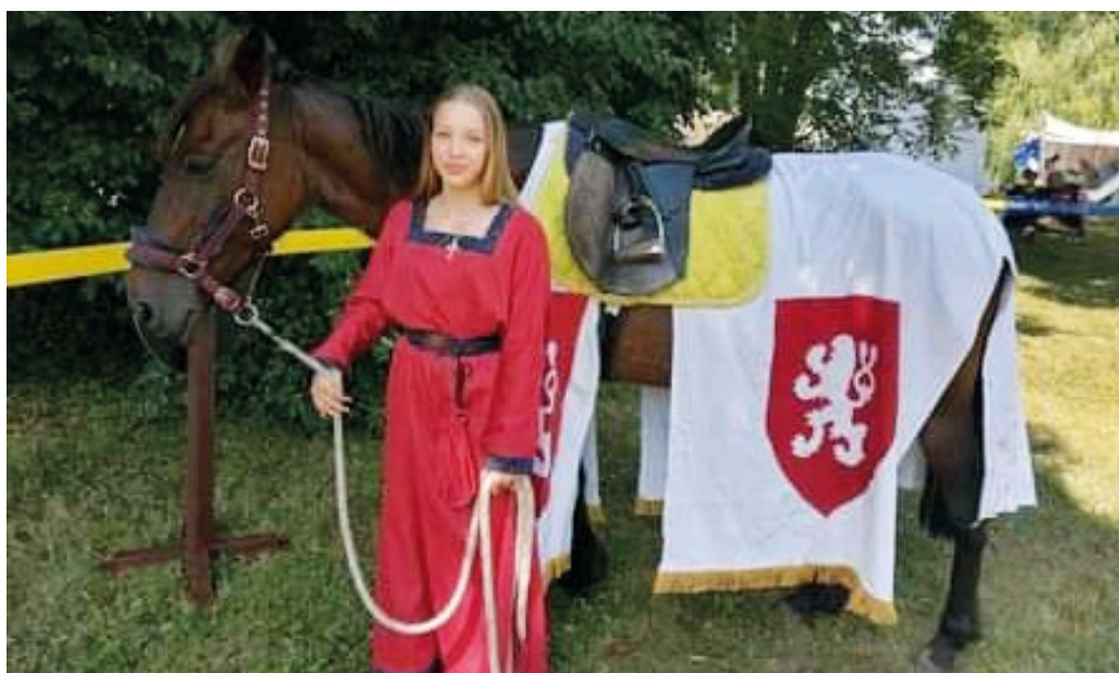
Kůň „českého krále“