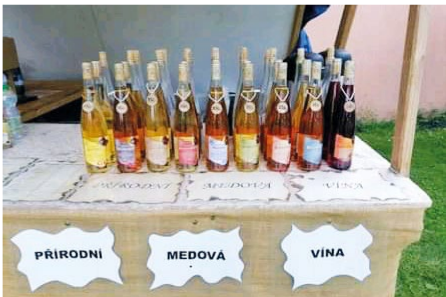
Rozmanitý výběr „staročeských“ medovin