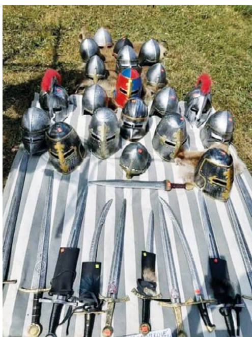
„Středověké“ meče a přilby