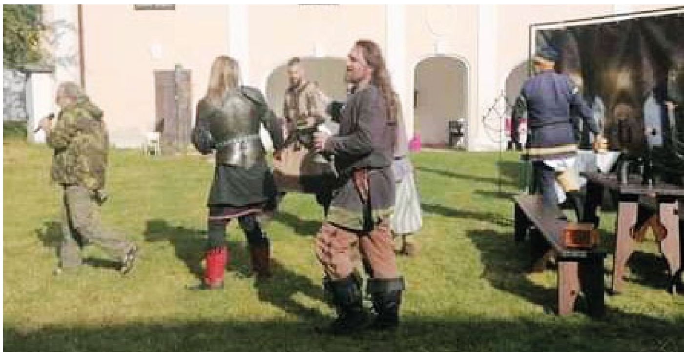
Na „středověkém nádvoří“ je rušno...