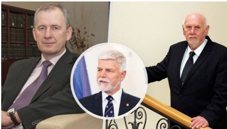
JUDr. Josef BAXA, nový předseda Ústavního soudu, prezident ČR Petr PAVEL, armádní generál v. v., a končící předseda Ústavního soudu JUDr. Pavel RYCHETSKÝ.