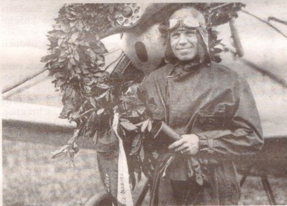
Major Alois Vicherek po ustanovení světového rekordu 7. června 1928, kdy uletěl 2500 km za 19.53 hodin